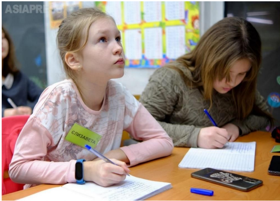
ミサイル攻撃を避けるため、地下鉄駅構内の仮設地下学校で授業を受ける子どもたち 2024年2月ハルキウ

ロシアによるウクライナへの侵攻から約2年半、戦争が長期化する中、人々はどのように暮らしているのでしょうか？